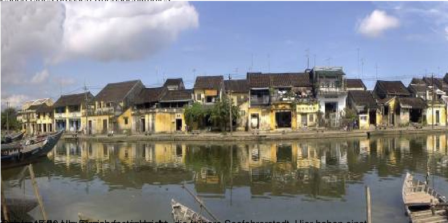
Reise 17.00 Uhr Europafestzug, die frühere Seefahrerstadt. Hier haben einst Handel und Europa festgehört.