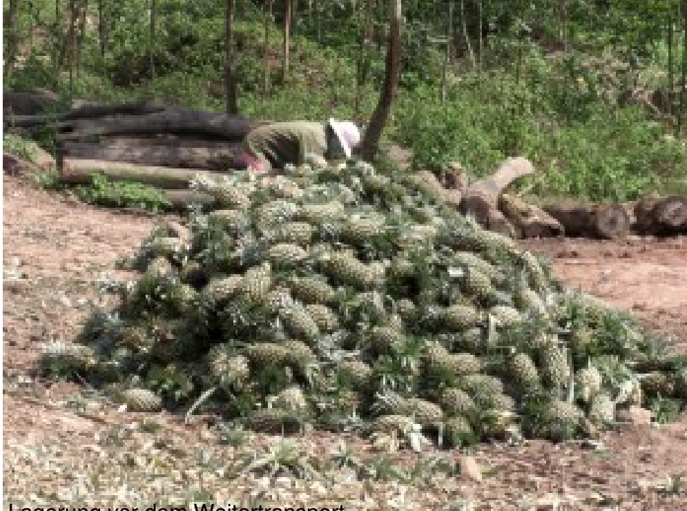
Lagerung vor dem Weitertransport.