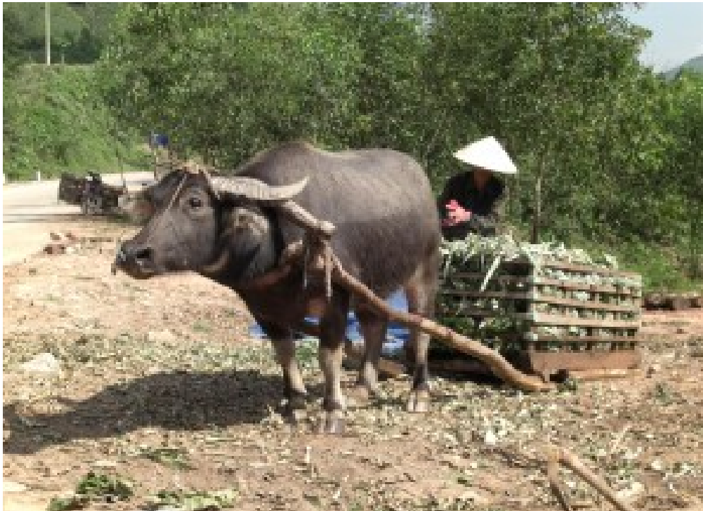
Per Wasserbüffel mit Schlitten kommen die Ananas zur Strasse runter.