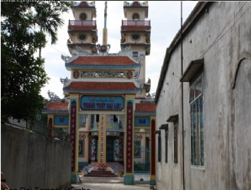
Gao Dai Tempel / Kirche.