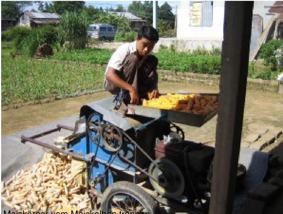
Maiskörner vom Maiskolben trennen