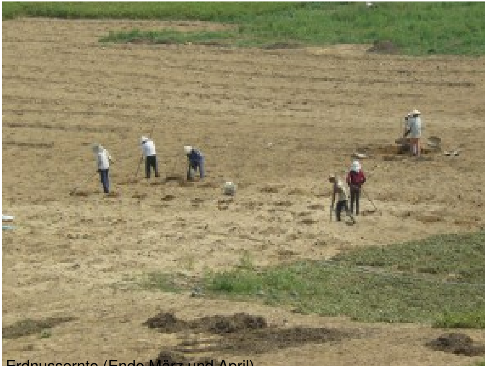
Erdnussernte (Ende März und April)