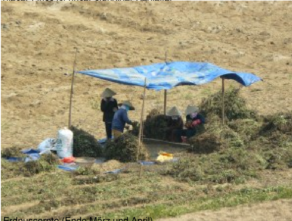
Erdnussernte (Ende März und April).