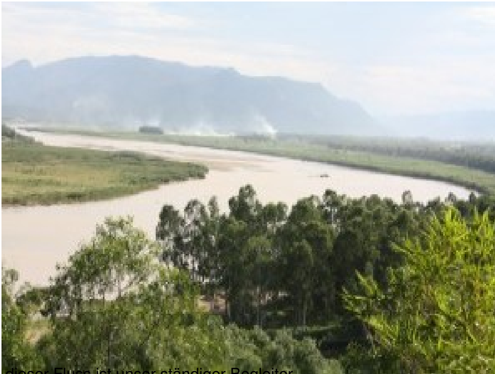
Dieser Fluss ist unser ständiger Begleiter