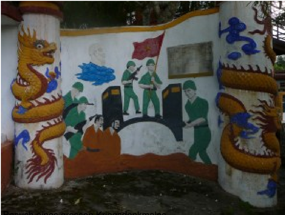
Besuch eines grossen Kriegsdenkmals