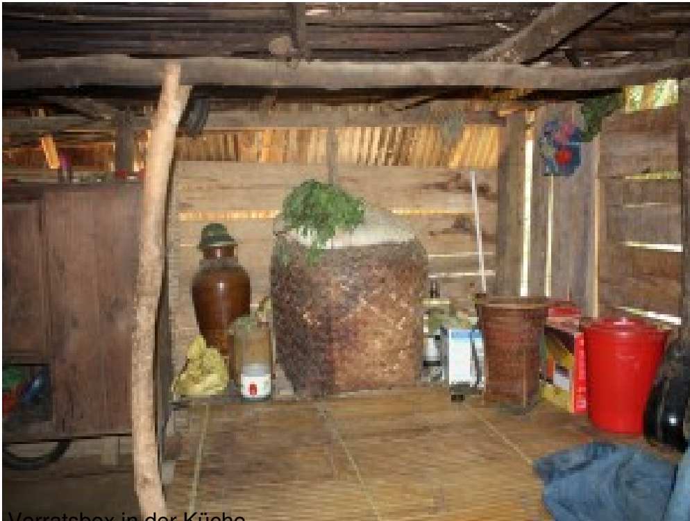
Vorratsbox in der Küche