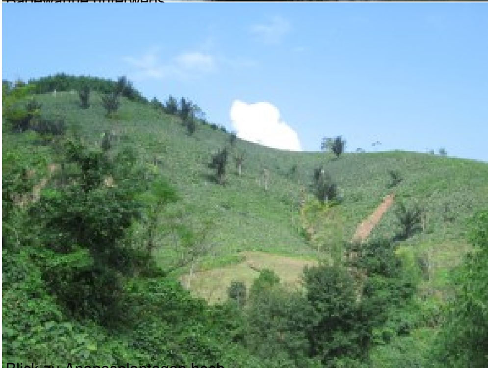
Blick zu Ananasplantagen hoch.