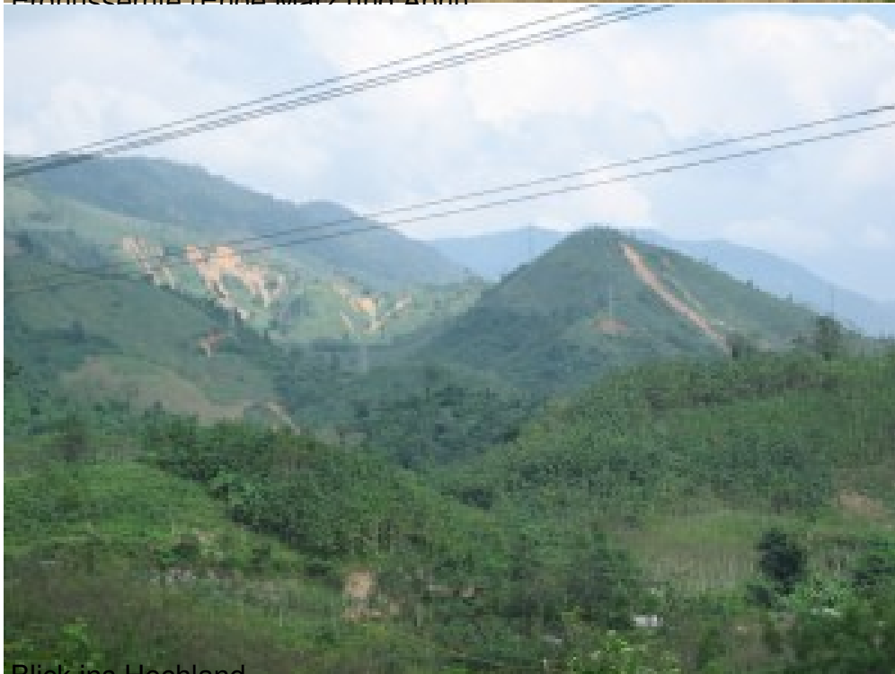
Blick ins Hochland.