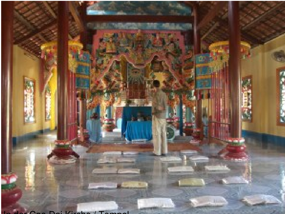
In der Cao Dai Kirche / Tempel