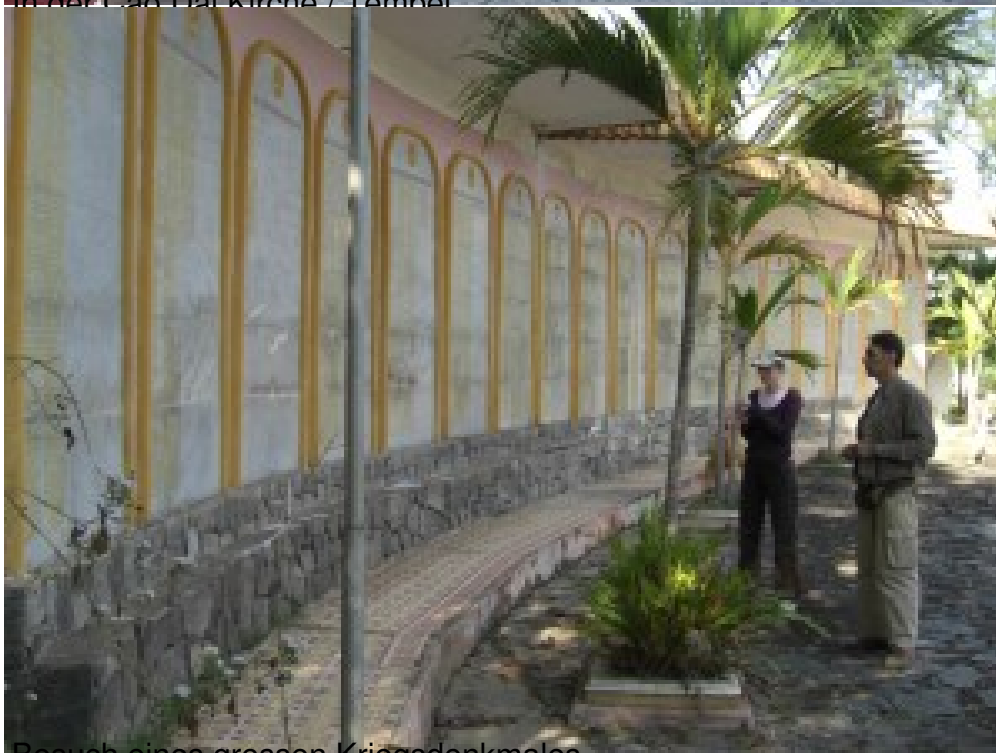
Besuch eines grossen Kriegsdenkmales.