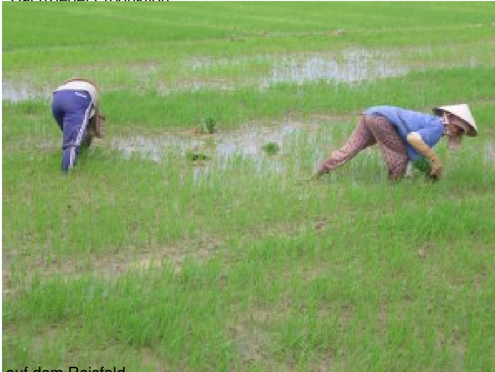
auf dem Reisfeld