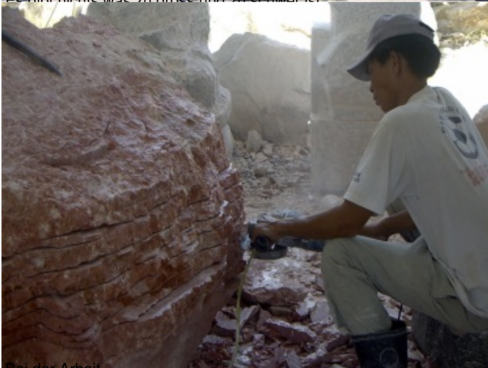
Bei der Arbeit.