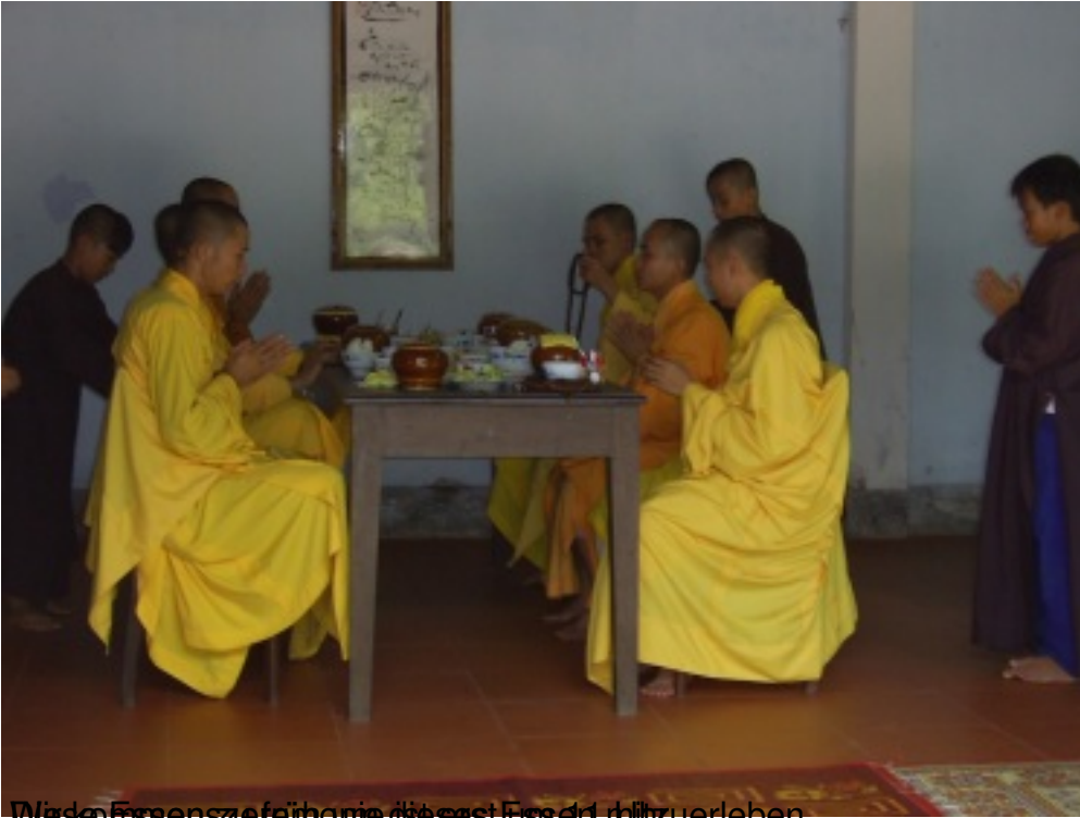
Nur die Freizeit genießen, aber die Feiern nicht erleben