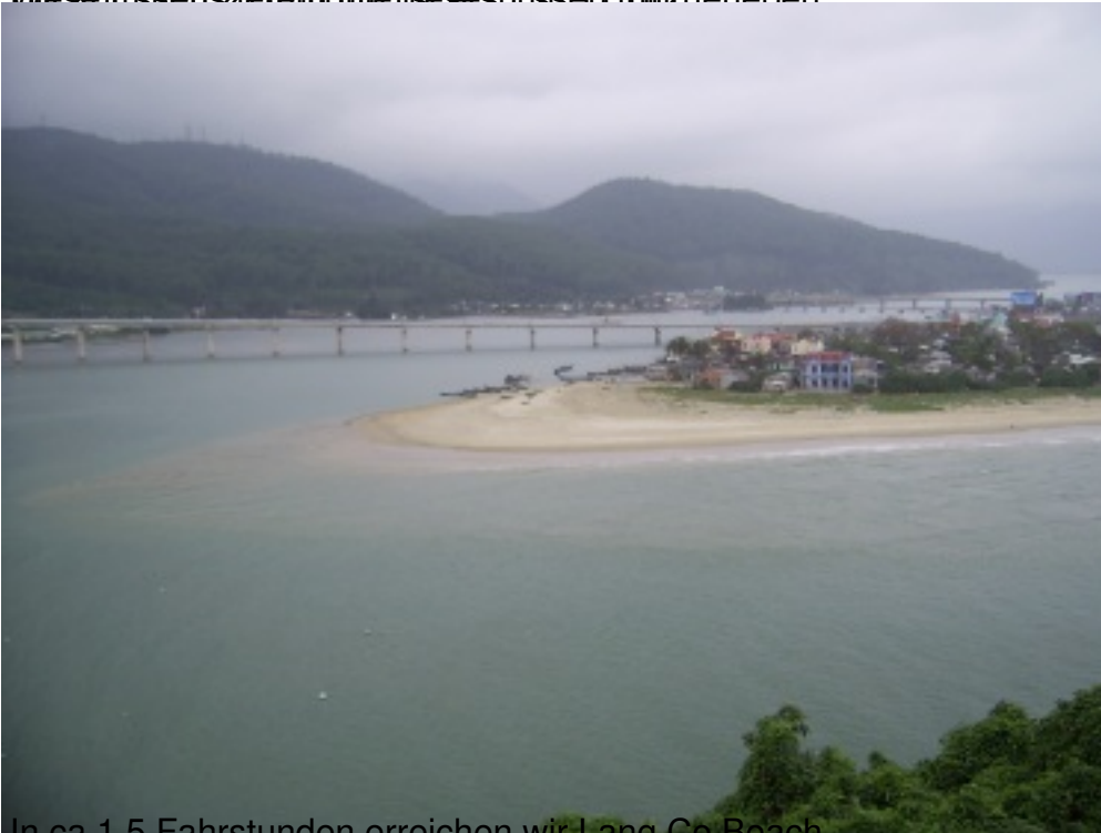
In ca.1,5 Fahrstunden erreichen wir Lang Co Beach.