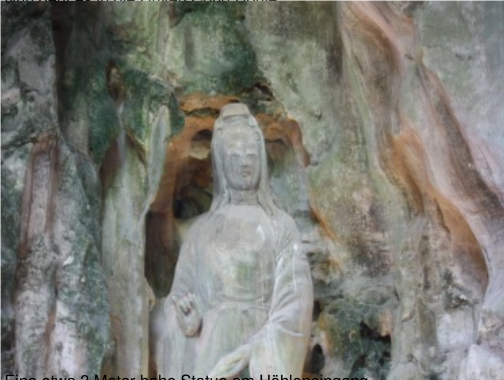
Eine etwa 3 Meter hohe Statue am Höhleneingang.