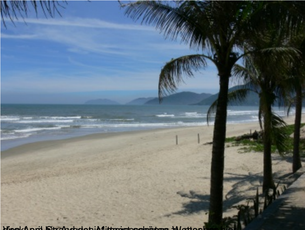
April bis Juni Strandaufenthalt mit Mietsechser Wetterbericht