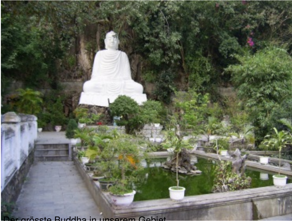
Der grösste Buddha in unserem Gebiet