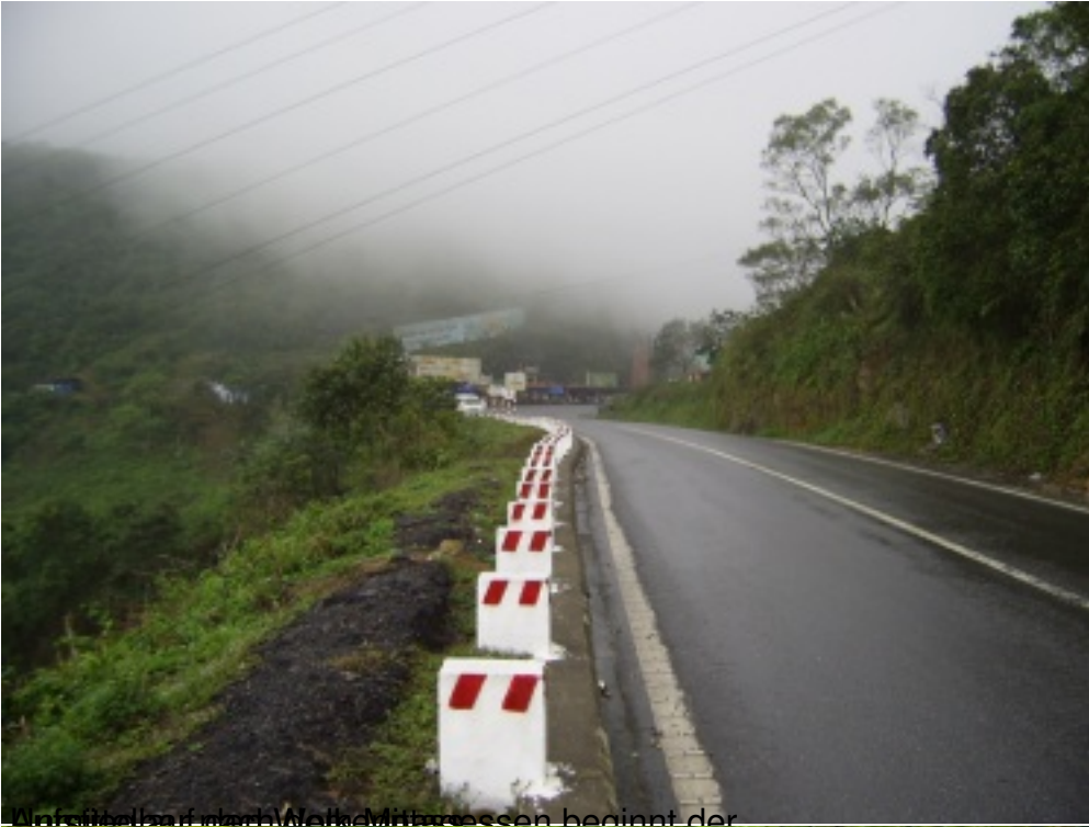
Ansicht auf die Welt im Zentrum beginnt der