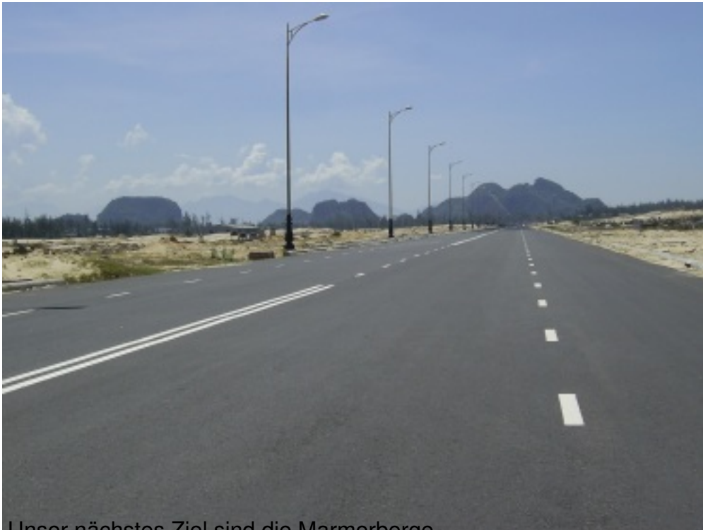
Unser nächstes Ziel sind die Marmorberge