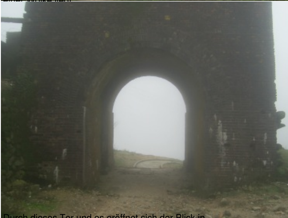
Durch dieses Tor und es eröffnet sich der Blick in