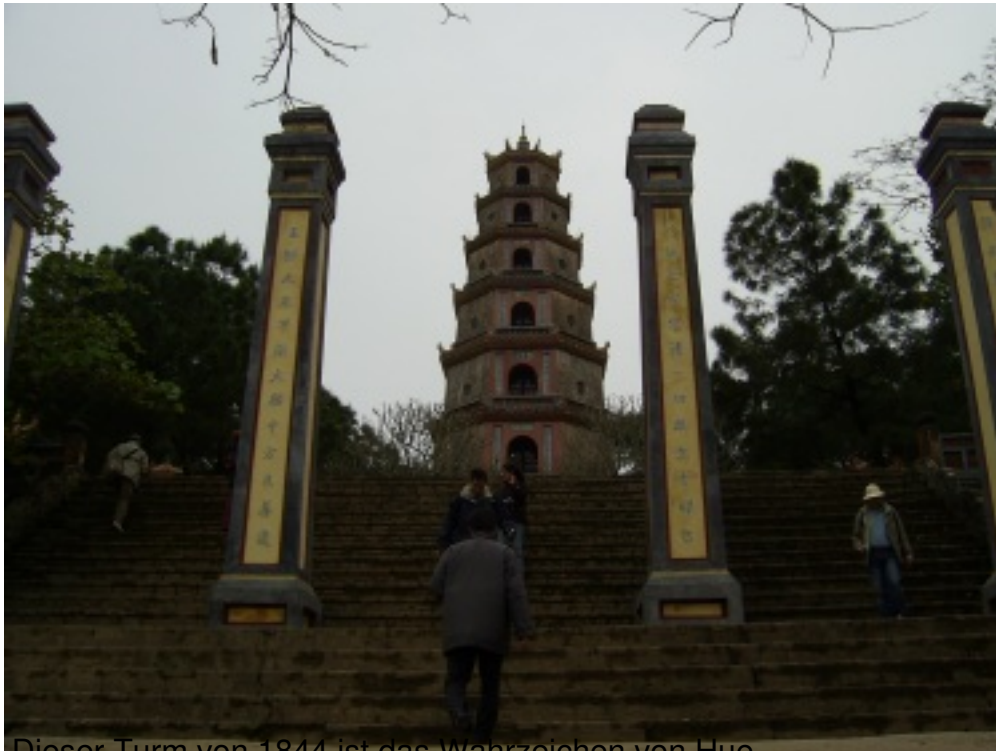
Dieser Turm von 1844 ist das Wahrzeichen von Hue