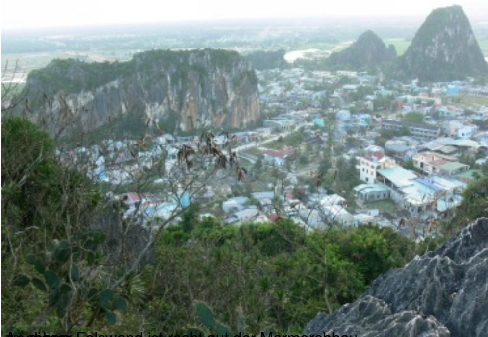
Zu sehen: Felswand ist recht gut der Marmorabbau