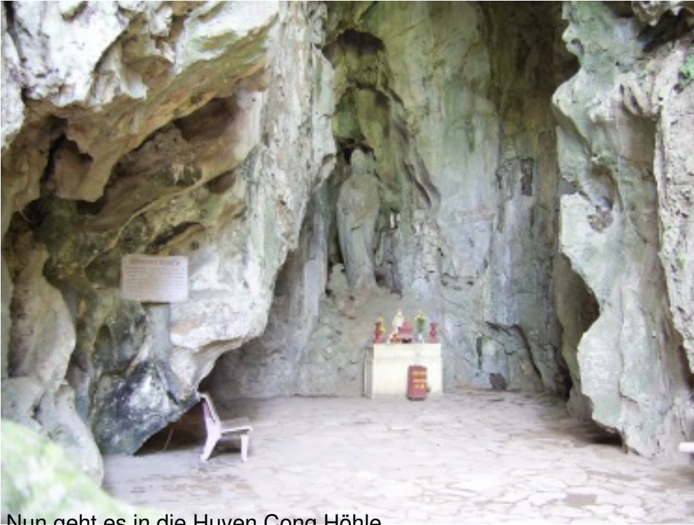
Nun geht es in die Huynh Cong Höhle