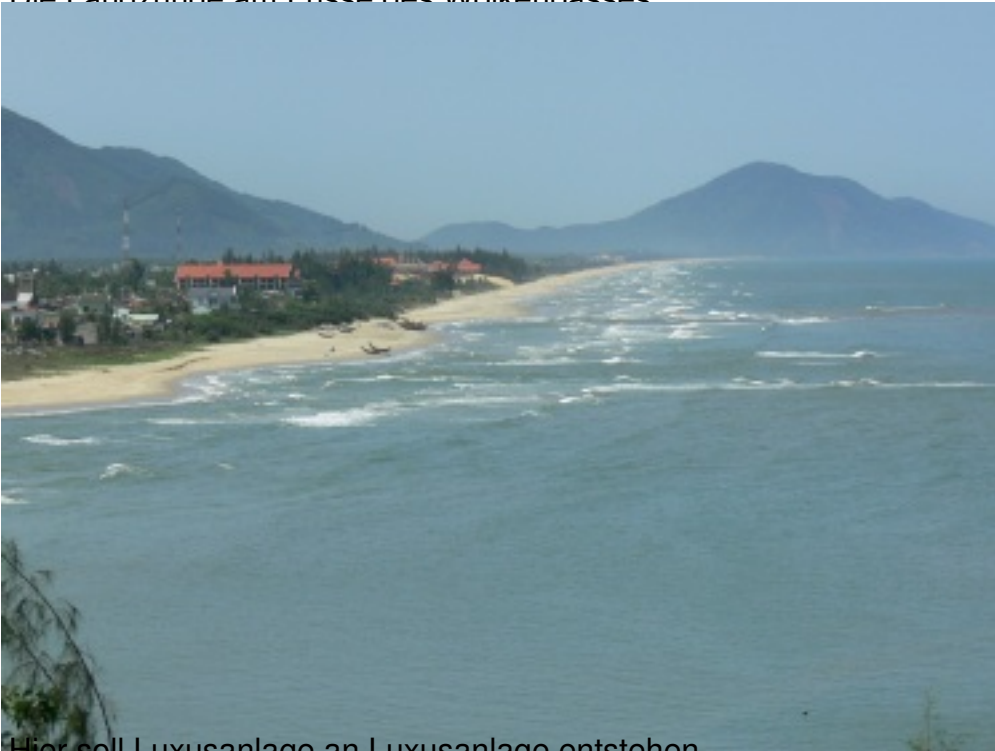
Hier soll Luxusanlage an Luxusanlage entstehen.