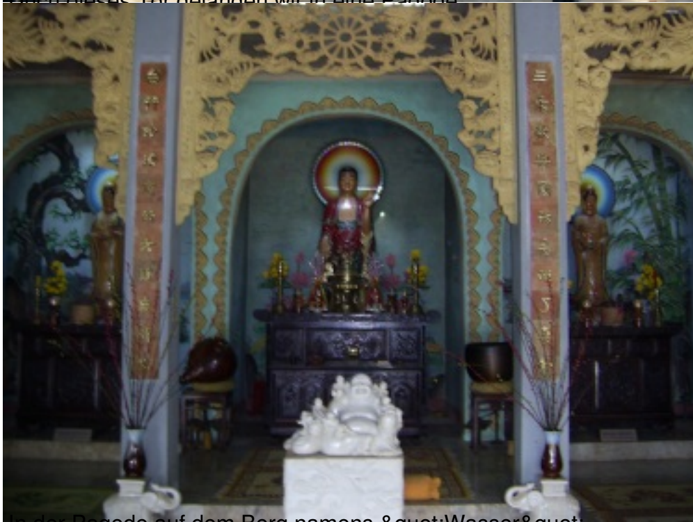
In der Pagode auf dem Berg namens "Wasser",