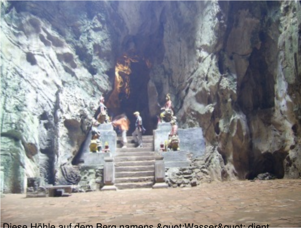
Diese Höhle auf dem Berg namens „Wasser“ dient