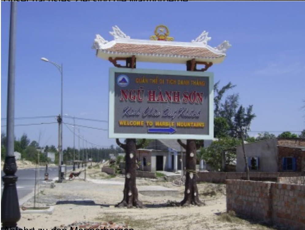
Abfahrt zu den Marmorbergen.