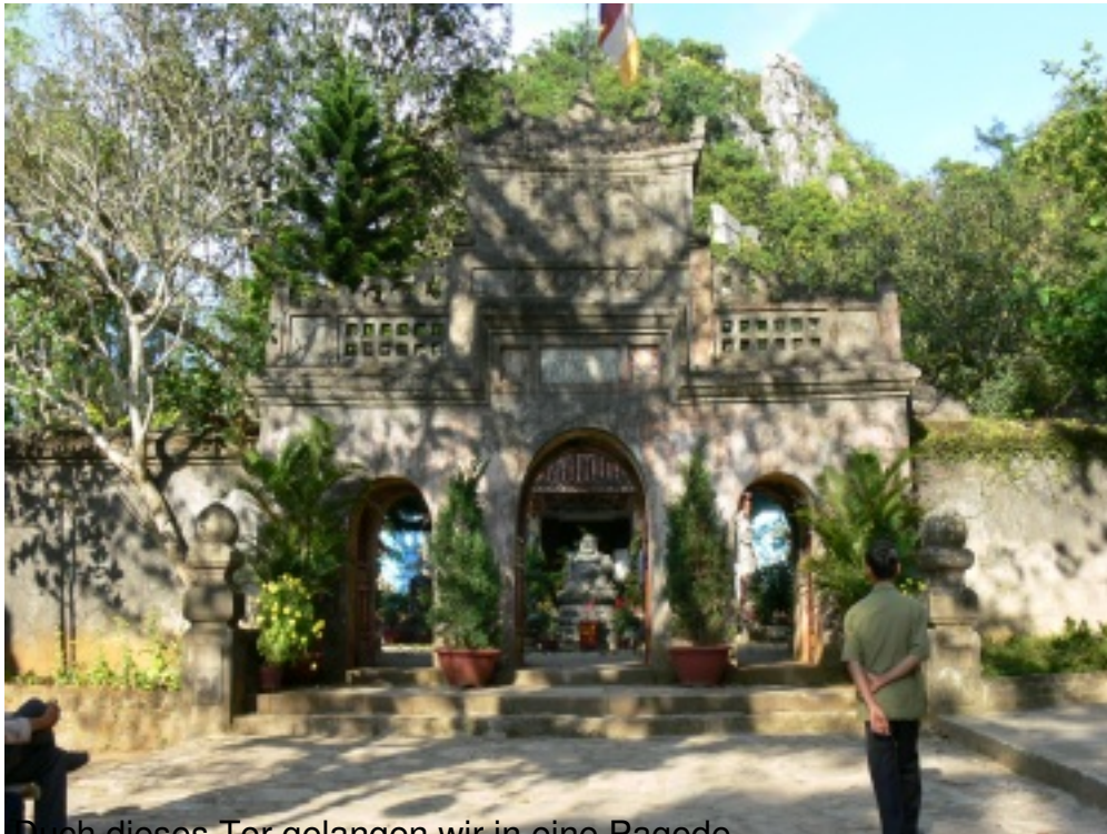
Durch dieses Tor gelangen wir in eine Pagode