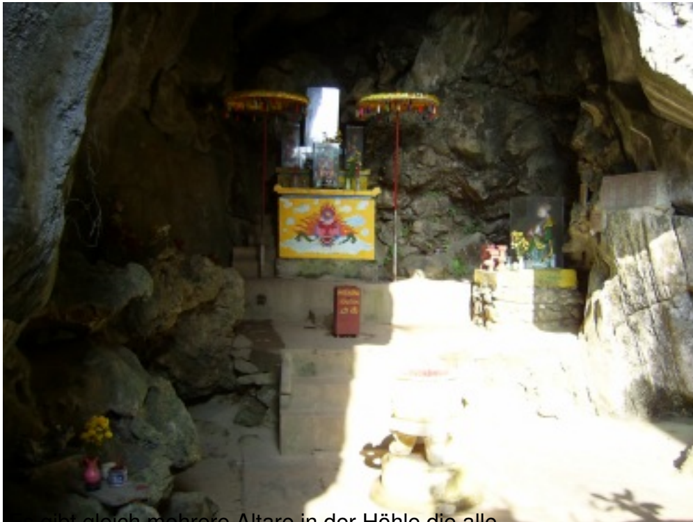
Es gibt gleich mehrere Altäre in der Höhle die alle