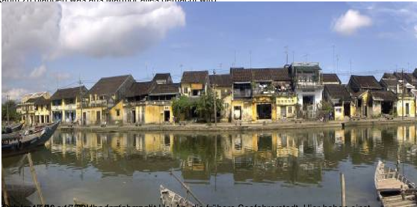
Heute 17.00 aus 500paesigenacht. Hoi An, die frühere Seefahrerstadt. Hier haben einst