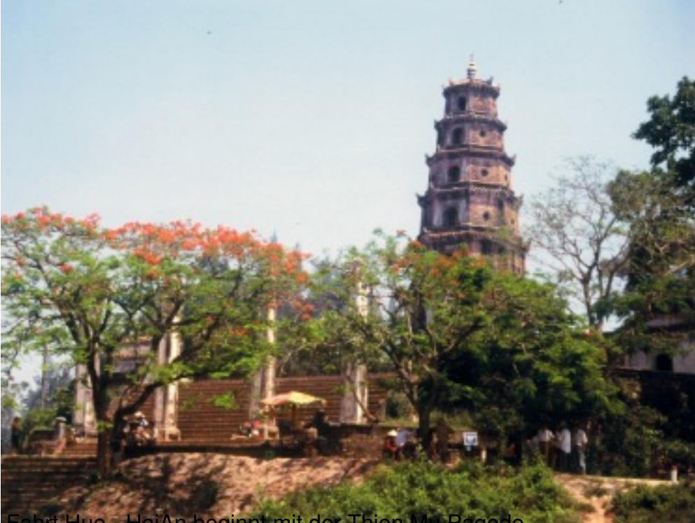
Fahrt Hue - HoiAn beginnt mit der Thien Mu Pagode

Reisezeit: 10 Tage (09.00 Uhr - 09.00 Uhr, Anflug) + 1 Tag in der deutschen Provinz Vietn Pausen: 10:00 Uhr - 11:00 Uhr (ca. 1 Stunde) und 14:00 Uhr - 15:00 Uhr (ca. 1 Stunde) Kilometerzahl ist die Kilometerzahl der Touristenbuslinie (Hue - Hoi An) Teilnehmerzahl berechnet. E