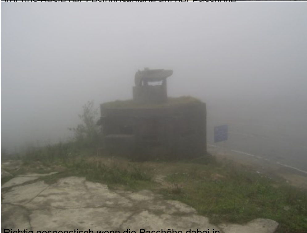
Richtig gespenstisch wenn die Passhöhe dabei in