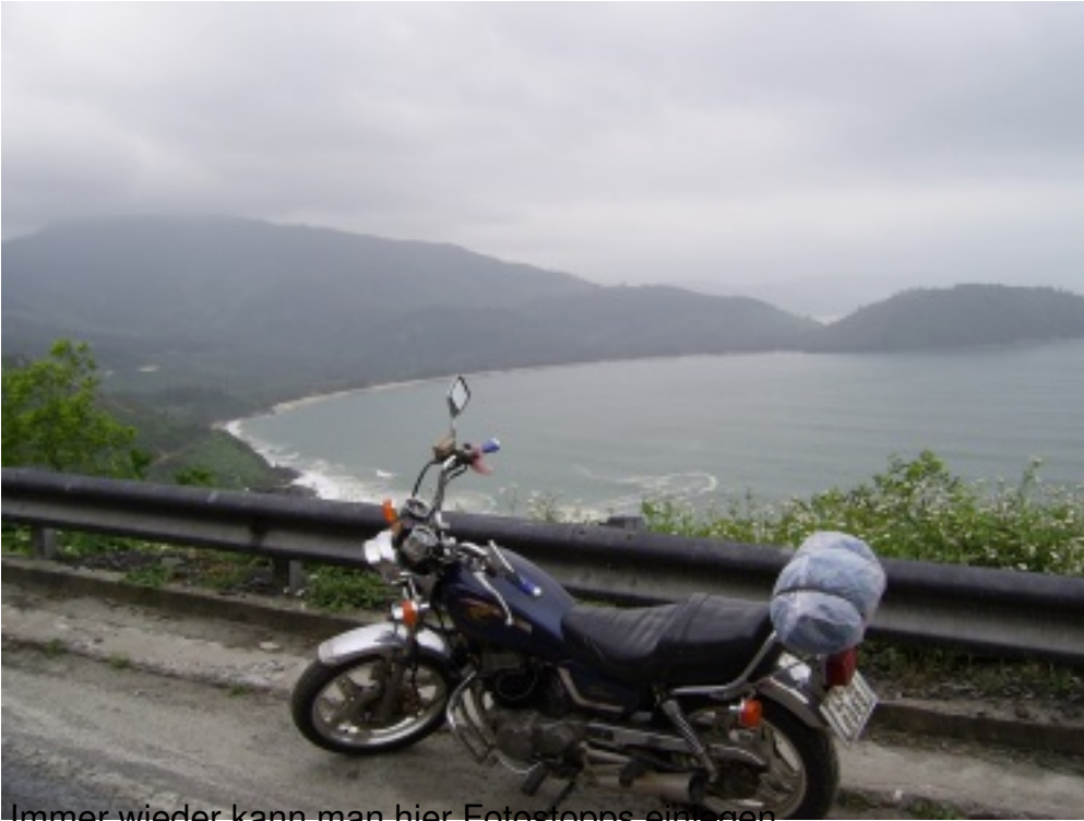
Immer wieder kann man hier Fotostops einlegen