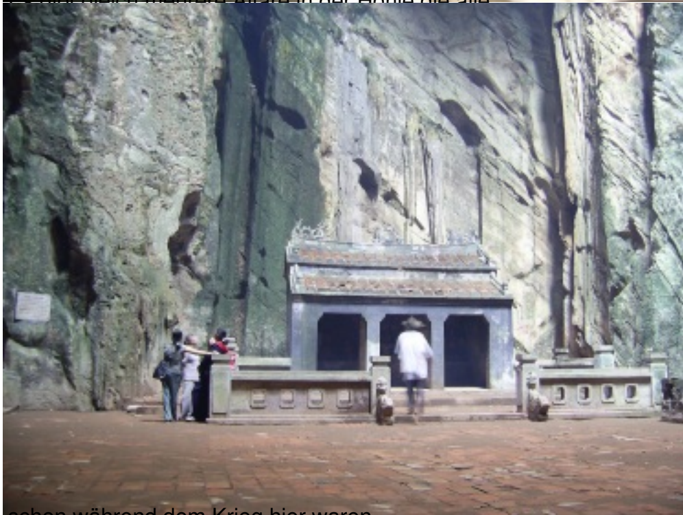
schon während dem Krieg hier waren.