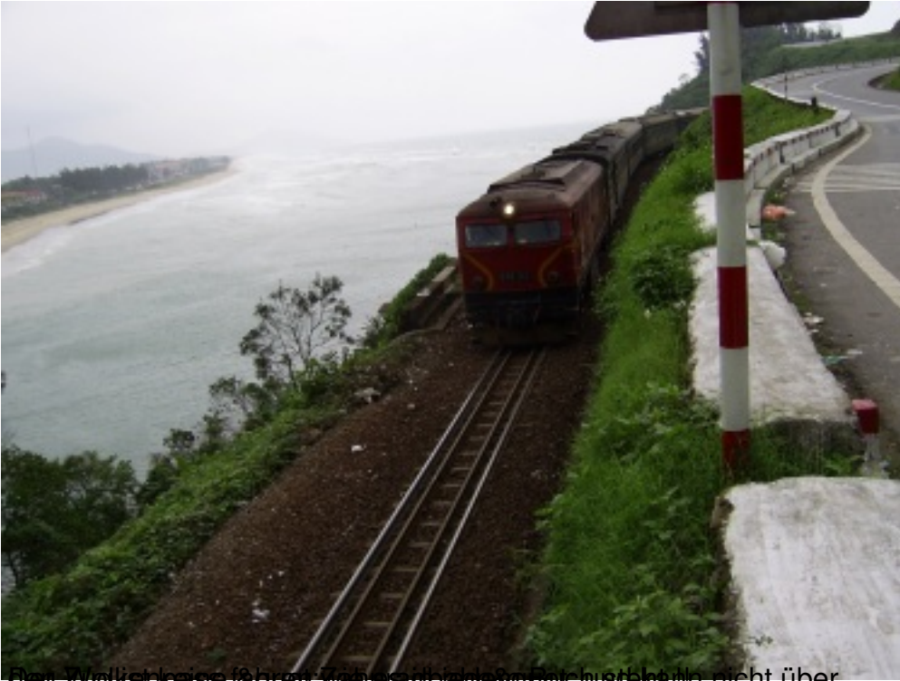
Am Wolkenpass führt das Eisenbahnstrecke für Luftkühler nicht über