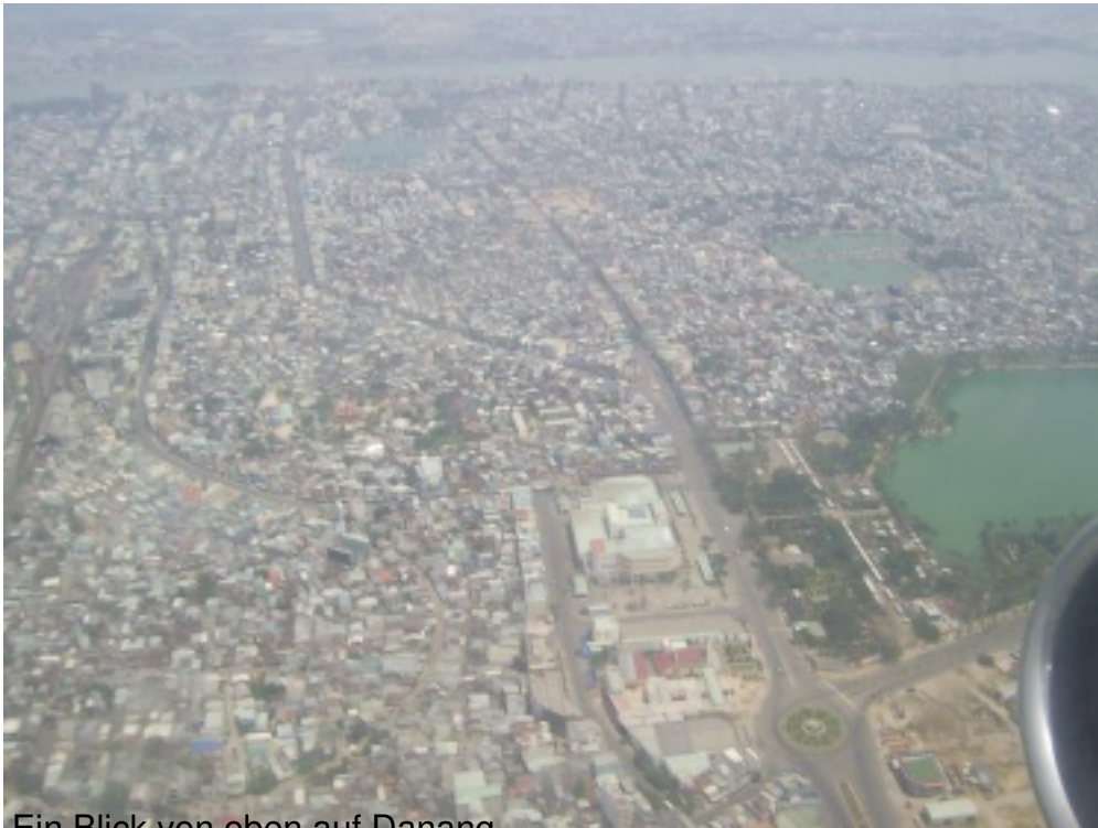
Ein Blick von oben auf Danang