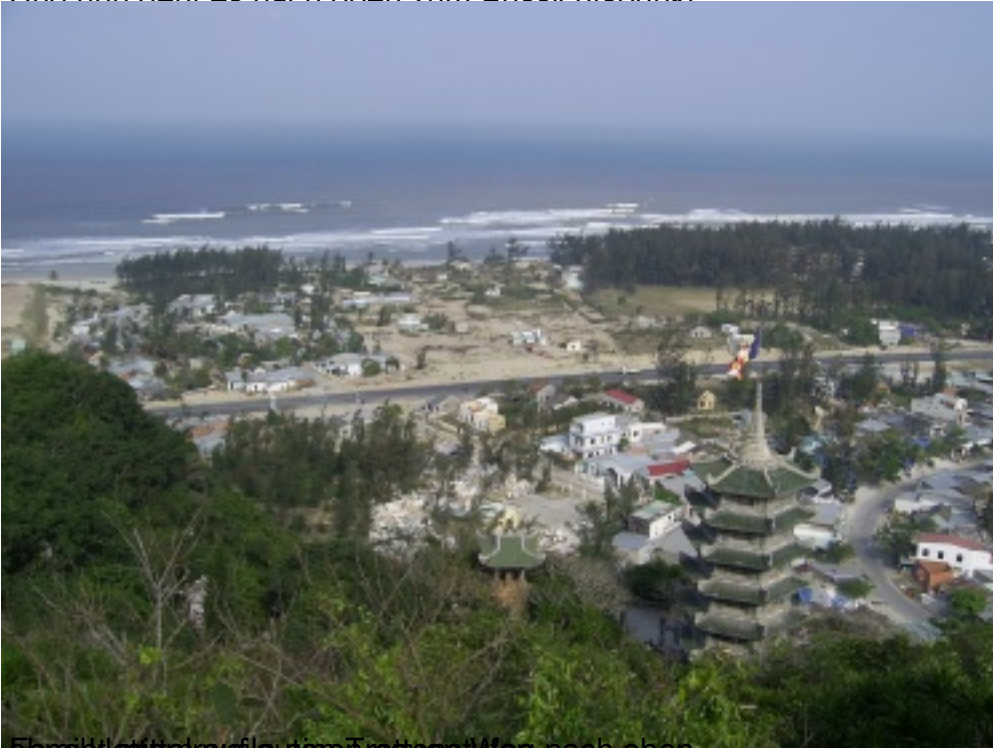
Es gibt eine tolle Aussicht vom Aussichtspunkt nach oben