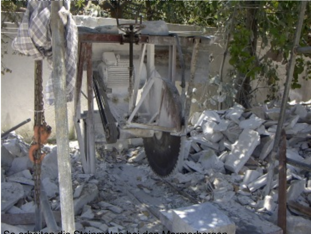
So arbeiten die Steinmetze bei den Marmorbergen.