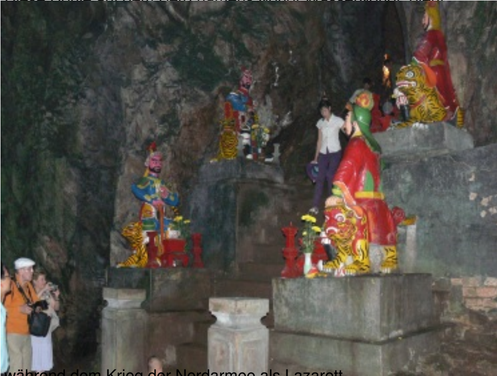
während dem Krieg der Nordarmee als Lazarett.