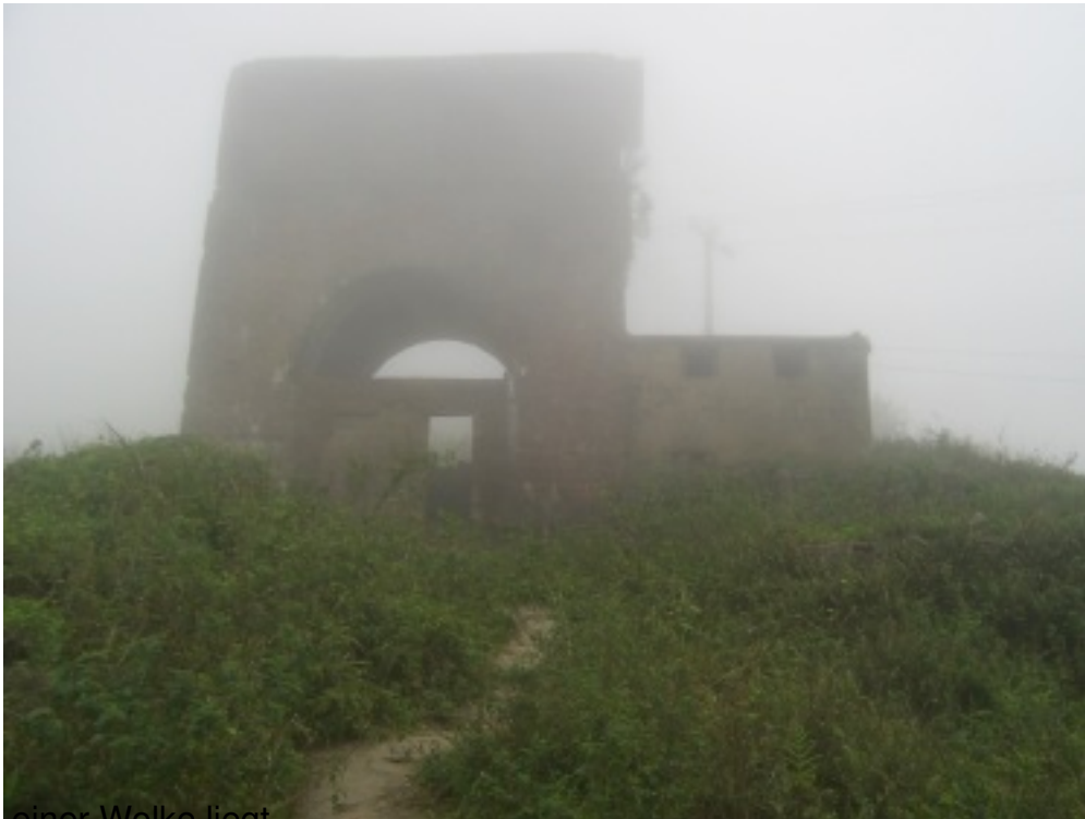
einer Wolke liegt