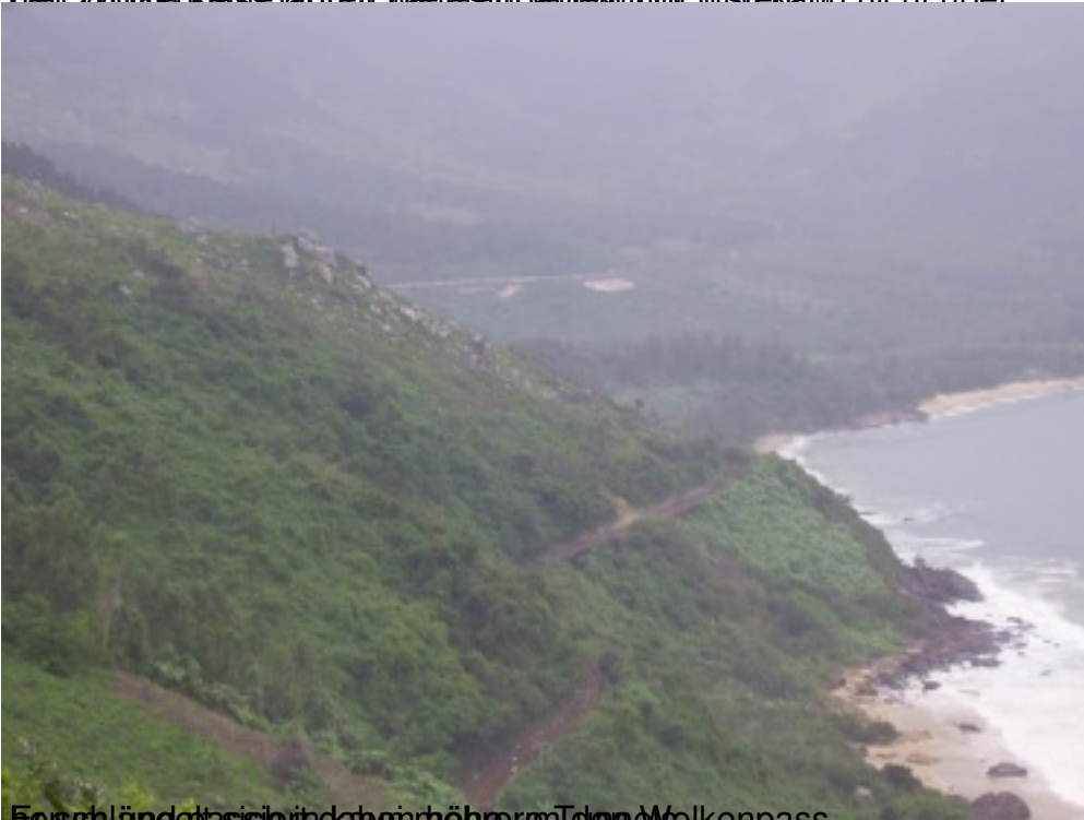
Erschlingelasse in der Höhe unter dem Wolkenpass