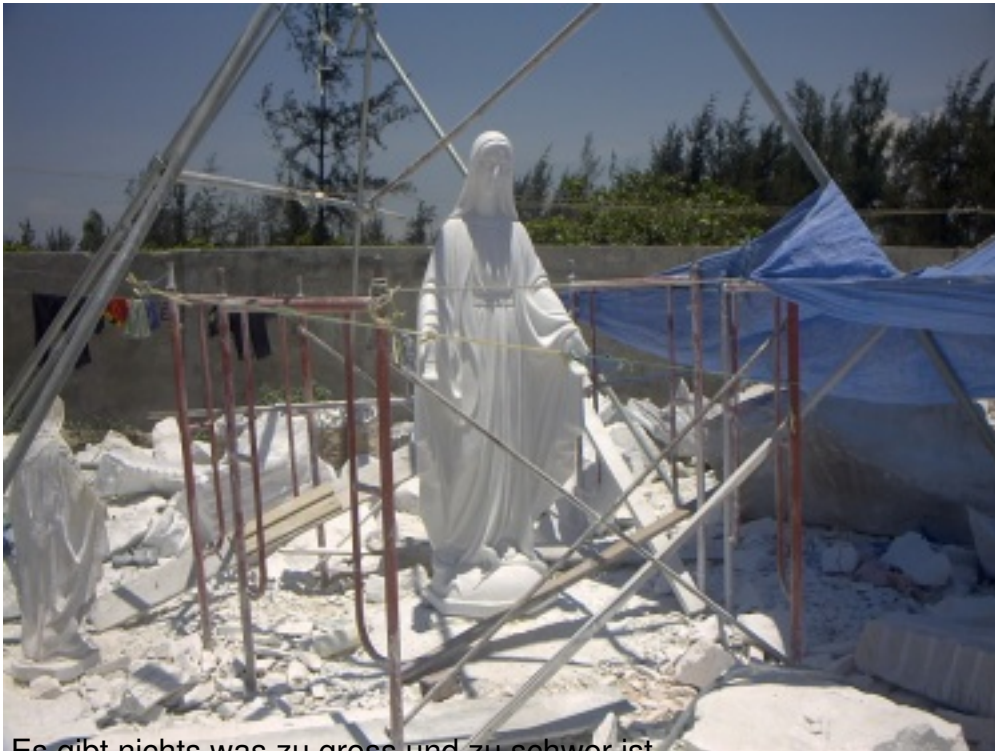
Es gibt nichts was zu gross und zu schwer ist