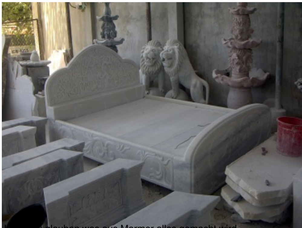
Kann zu glauben was aus Marmor alles gemacht wird