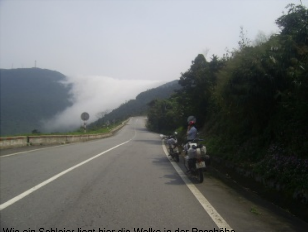
Wie ein Schleier liegt hier die Wolke in der Passhöhe