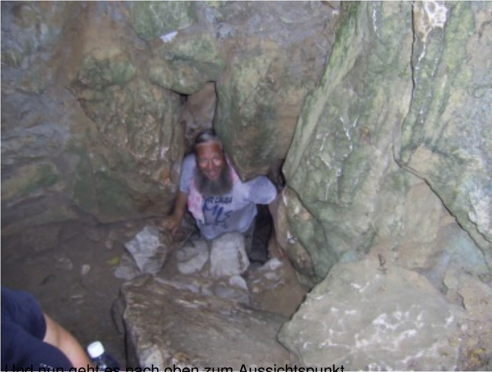
Und nun geht es nach oben zum Aussichtspunkt