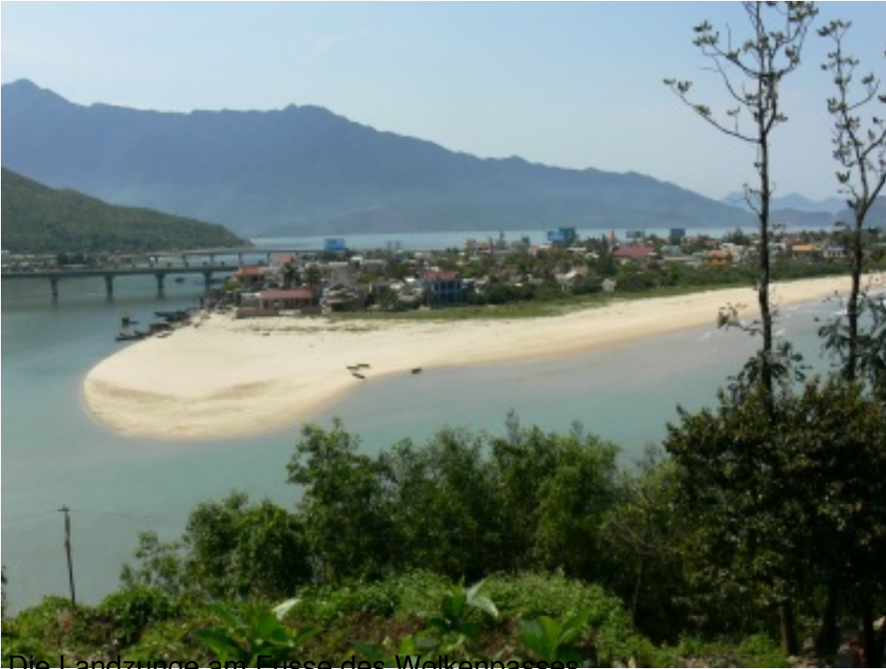
Die Landzunge am Ende des Wolkenpasses