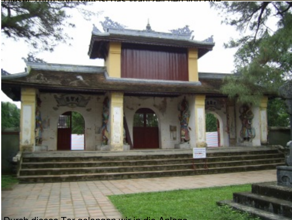
Durch dieses Tor gelangen wir in die Anlage.