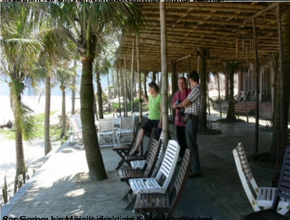
September bis März Heideckert Schwimmbad