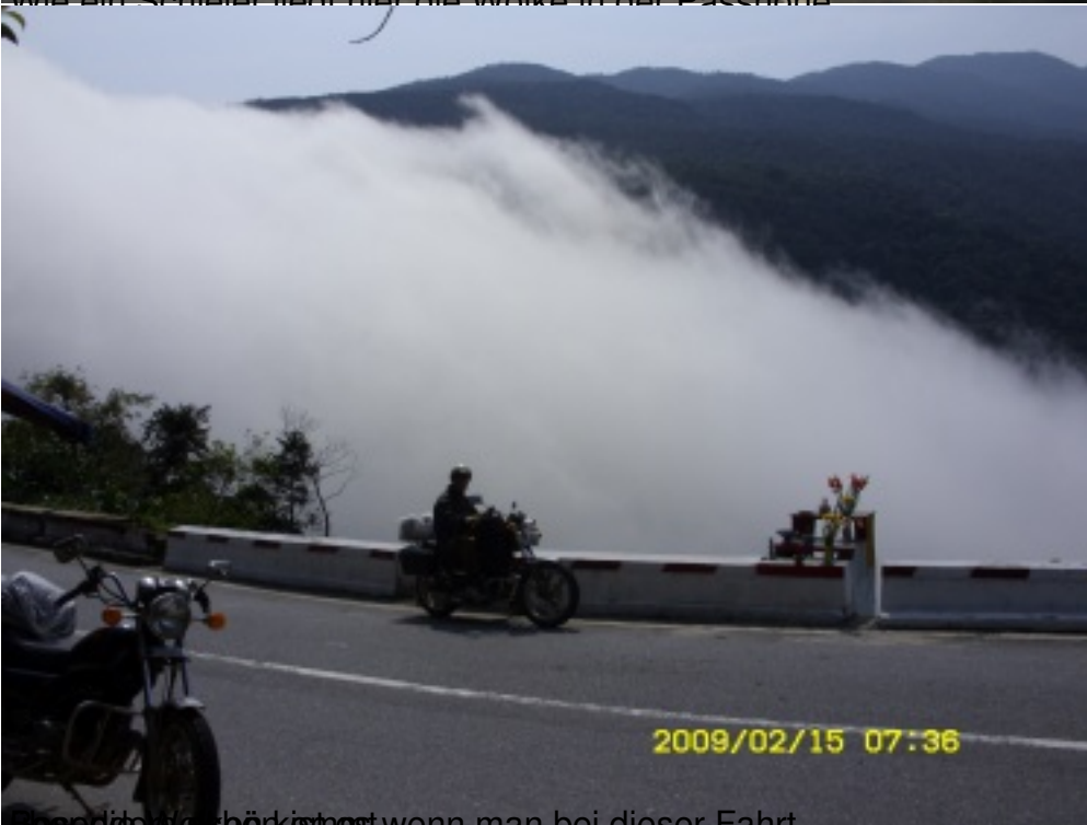
Das sieht sich wirklich aus, wenn man bei dieser Fahrt