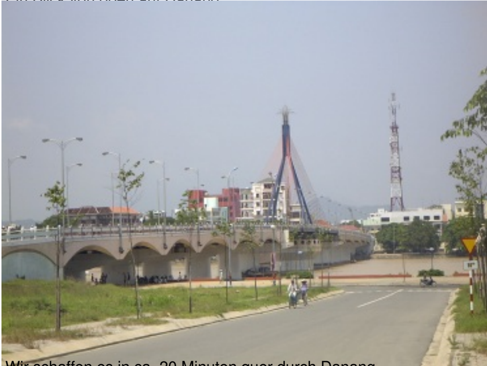
Wir schaffen es in ca. 20 Minuten quer durch Danang.