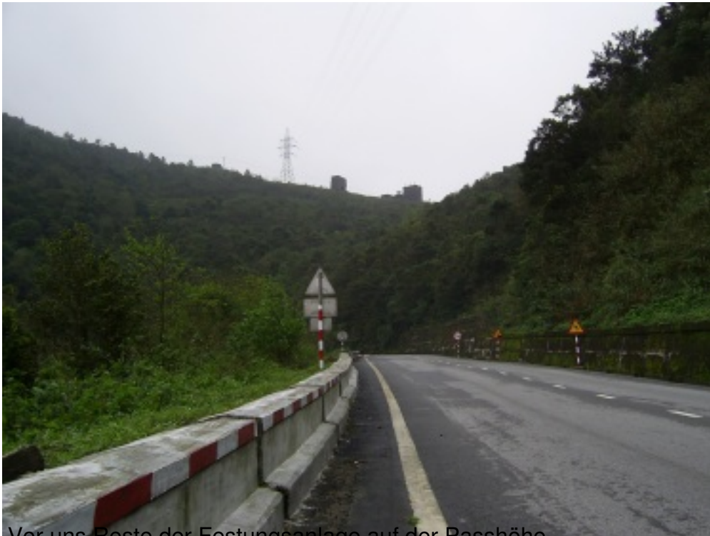
Vor uns Reste der Festungsanlage auf der Passhöhe