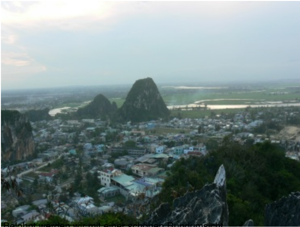
Belohnt werden wir mit einer schönen Rundumsicht