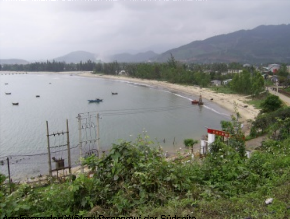
Am Ende des Wochenendes auf der Südseite