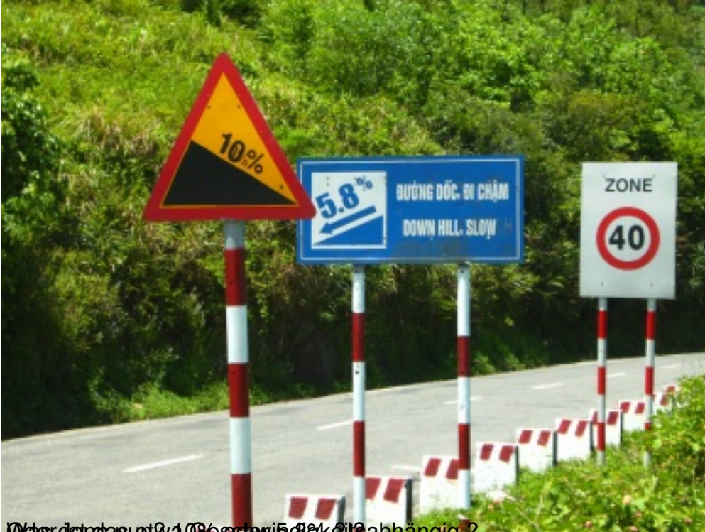
Was ist das etwa (9% oder 5,8%) abhängig?